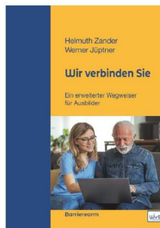
Die Neuauflage des Handbuchs

Die beiden Autoren bitten jedoch um eine Spende von 12,- € für Seniorenprojekte zugunsten der Stiftung der Deutschen Lions (IBAN DE40 5019 0000 0000 4005 05, BIC: FFVBDEFFXXX, Stichwort „Wir verbinden Sie“).