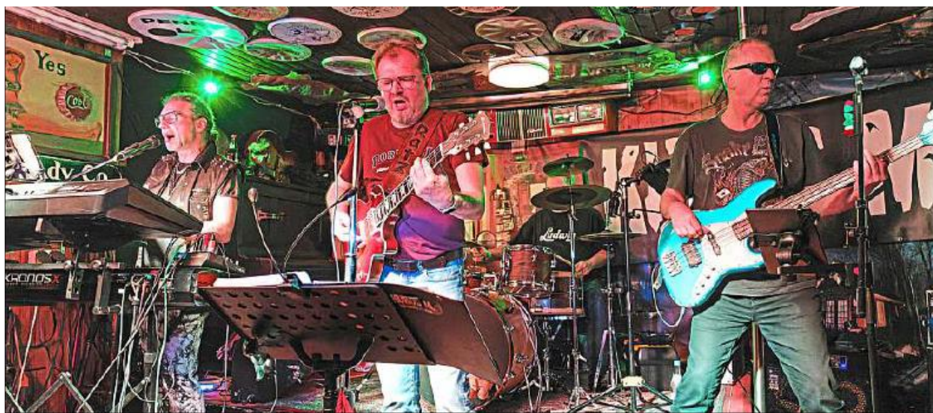
Drei Bands stehen am 11. November auf der Bühne: Kubus M. (im Bild), Big 5 und Flashlight.