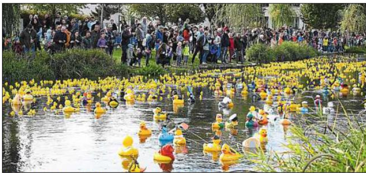
Zum Entenrennen auf der Sulz lädt der Lions Club auch heuer wieder ein.