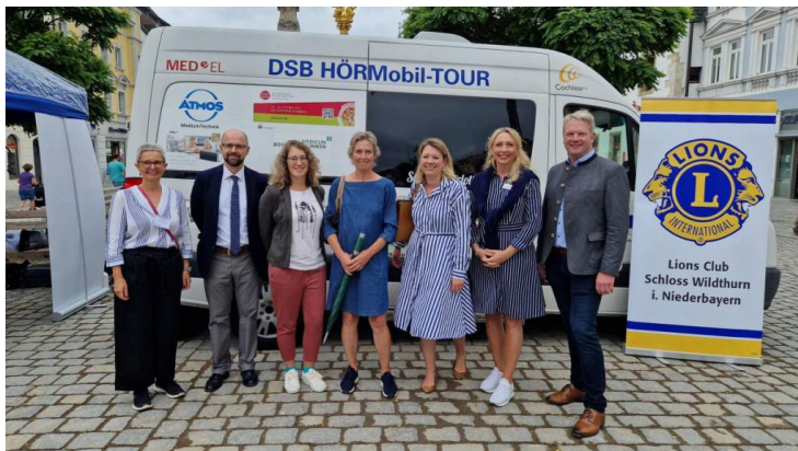
Straubinger Tagblatt vom 24. Juni 2023 Text/Foto: Jessica Seidel

Viele interessierte Bürger haben am 23. Juni 2023 das Angebot des Hörmobils des Deutschen Schwerhörigenbundes genutzt. Das Hörmobil stand von 10 bis 16 Uhr auf dem Theresienplatz in Straubing, mit vielen Angeboten und Ansprechpartnern rund um die Themen Ohrgesundheits, Schwerhörigkeit sowie operative Möglichkeiten. Vor allem der kostenlose Hörtest, der ohne Anmeldung direkt vor Ort durchgeführt