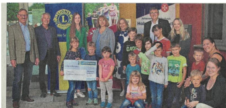
Die Spendenübergabe im Kinderhaus.

Obwohl der personelle und zeitliche Aufwand für die Durchführung eines Rennens je-weils erheblich ist, leisten die Mitglieder des Lions Clubs Oberpfälzer Jura, die sich aus dem gesamten ehemaligen Landkreis Parsberg rekrutieren, diesen Dienst gerne gemäß dem erklärten Lionsziel, „sich für das Wohl der Gesellschaft einzusetzen“. Unterstützt werden sie dabei kräftig durch das THW Laaber und durch lokale Unternehmen, Praxen und Einzelpersonen, insbesondere durch deren Spendenbeteiligung am Großtenrennen. Der Markt Laaber fördert die Aktivität des Lions Clubs ideell und auch ganz praktisch, zum Beispiel durch die Zur-Verfügung-Stellung von Platz für Veröffentlichungen in diesem Mitteilungsblatt