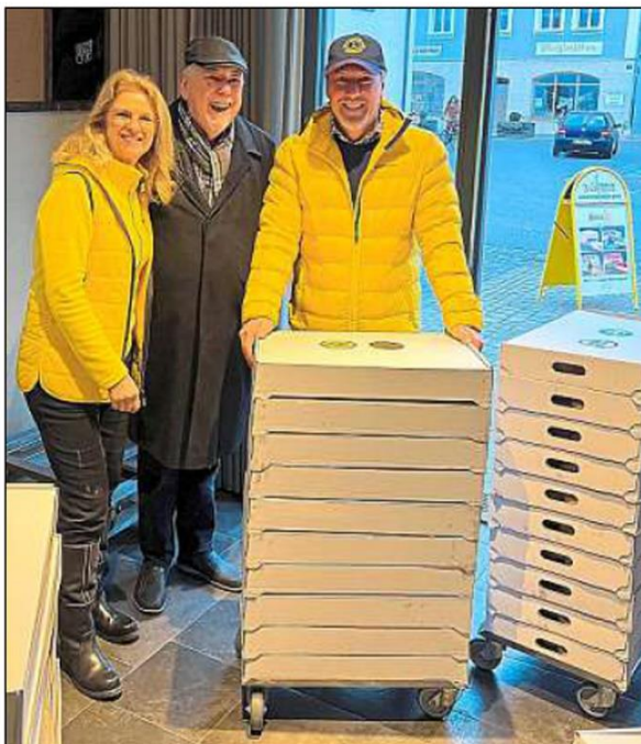
Mit Vorfreude blicken die Beilngrieser Lions der inzwischen sechsten Auflage der Krapfen-Aktion entgegen.

„Zum Mitmachen sind vor allem Geschäfte und Unternehmen in der Region Beilngries, Mühlhausen, Berching, Kinding, Greding, Diefurt, Altmannstein, Riedenburg, Denkendorf, Aschbuch herzlich eingeladen“, heißt es in der Mitteilung der Lions. Und