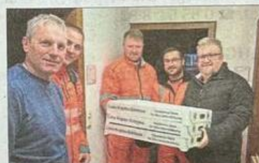
Reichlich Krapfen gab's auch für den Kreisbauhof FRG.