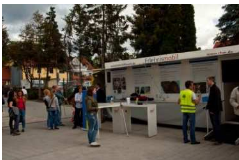
Informationsbedarf und Gespräche nach Durchlaufen des Parcours

Am Ausgang des Mobils kann man daher betroffene Reaktionen beobachten, gepaart mit Bewunderung und vor allem sichtlicher Erleichterung der Teilnehmer, wenn sie die Brillen wieder ablegen dürfen.