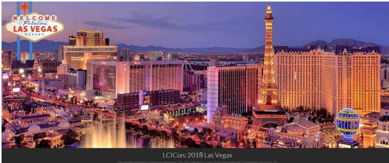
LCICon: 2018 Las Vegas

SAVE THE DAY - 29. JUNI - 03. JULI 2018 - 101. INTERNATIONAL CONVENTION LAS VEGAS, USA - SAVE THE DAY