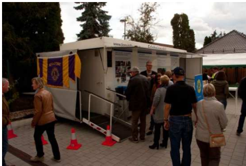
Großes Interesse der Besucher - Am Eingang des Blindenmobils herrschte immer Andrang

Vor dem Eintritt in das Blindenmobil erhält hierzu jeder Teilnehmer eine Brille, die die Sehkraft bei grauem Star im Endstadium simuliert. Die Sicht ist schemenhaft, man erkennt den Unterscheid zwischen hell und dunkel und kann ansonsten nur erahnen, was vor einem liegt. Ausgestattet mit einem Taststock versuchten die Besucher so den Weg durch das Blindenmobil zu meistern. Verschiedene Bodenbeläge, eingebaute Treppen und Hindernisse machen dabei den kurzen Weg zur Herausforderung.