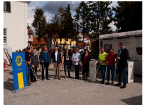
LIONS Blindenmobil am Hemauer Michaelimarkt

Das Blindeninstitut ist in Hemau eine relativ junge Einrichtung, seit 2012 bietet es im Alten Postgebäude Platz für erwachsene Blinde und Mehrfachbehinderte Dauerpatienten und Gäste. Zum alljährlichen Hemauer Michaelimarkt wurden die Pforten des Instituts geöffnet und der liebevoll im ehemaligen Postverladehof angelegte Sinnesgarten mit vielen fühlbaren riechbaren und v.a. auch essbaren Pflanzen präsentierte sich einem breiten Publikum.