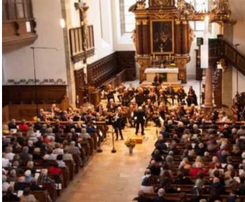
Die voll besetzte Kirche mit dem Symphonieorchester Deutscher Lions

neu renovierten Evang.,Luth. Dreieinigkeitskirche aus dem Jahre 1635 in Regensburg zugunsten der neuen Bachorgel statt.