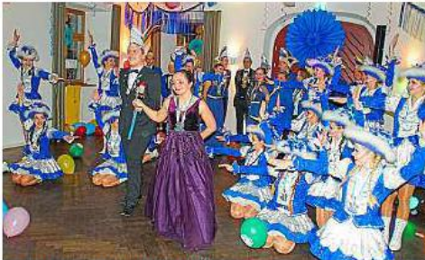
Die Hechtonia mit ihrem Prinzenpaar.

■ Berching/Beilngries (e) Das Berchinger Hotel Post hat am 15. Februar eine alte Tradition wieder aufgenommen und war Gastgeber des 1. Lions-Faschingsballs. Der Faschingsball wurde vom Hilfswerk des Lions Club Beilngries als Benefizveranstaltung zugunsten der Klinik-Clowns veranstaltet. Die Hechtonia und DJ Marc Wirtz aus Nürnberg sorgten für Spaß und Lebensfreude. Bis in die frühen Morgenstunden feierten die Ballgäste ausgelassen.