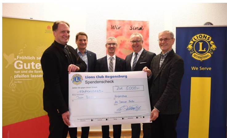
Der Lions Club Regensburg konnte 5000 Euro übergeben.