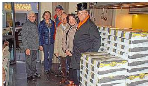
Über 6.000 Krapfen hat die Bäckerei Plank gebacken.

„Dem Unsinnigen“ einen Sinn geben – unter diesem Motto stand die Krapfen-Aktion am namensgebenden Unsinnigen Donnerstag, den 20. Februar 2020. Heuer werden die Lions wieder Wünsche unserer Senioren in Heimen unserer Region erfüllen. Jeder Krapfen steht für eine Spende von 75 Cent, die direkt in unser Projekt fließen. Für die Unterstützung durch die Bäckerei Plank aus Mühlhausen danken die Beilngrieser Lions sehr herzlich.