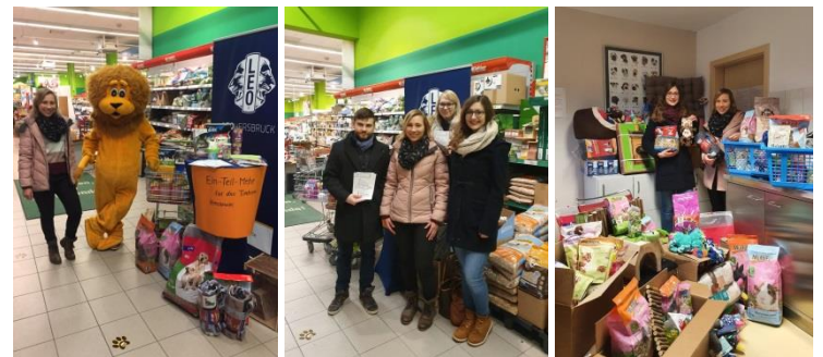
Text und Fotos: Leo Club Hersbruck