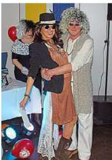
Uschi Obermaier und Rainer Langhans gewannen den 1. Preis.

Das Motto des Abends: „Berühmte Persönlichkeiten“ ob aus Film, Funk, Fernsehen, Politik, Sport etc. wurde von den Ballbesuchern kreativ umgesetzt. So gaben sich Donald Trump, Michael Jackson, John Lennon mit Yoko Ono, Abba sowie viele weitere Personen des öffentlichen Lebens und der Geschichte die Ehre. Marilyn Monroe erschien genauso im Doppelpack wie Cäsar. Auch das englische Königshaus war mit Prinz Harry vertreten.