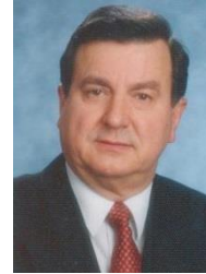
GOVERNOR 2022/2023 FRANZ GÖHL