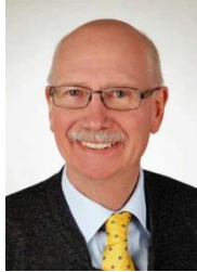
PGRV UND GOVERNOR 2021/2022 WILHELM SIEMEN