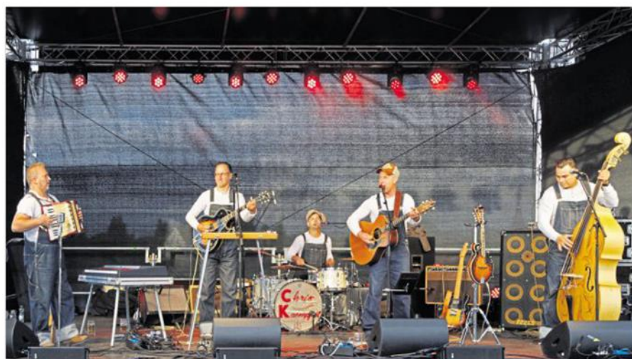
Die „Sunny Bottom Boys“ aus Straubing sorgten mit typischen Countrysongs für die passende Musik.

Wenn es auch etwas frisch war für ein Sommernachtsfest, waren schnell alle Plätze eingenommen und die Fans feierten bis weit nach Mitternacht. Mit der Open-Air-Veranstaltung würdigte der Lions-Club Tirschenreuth als Veranstalter gleichzei-