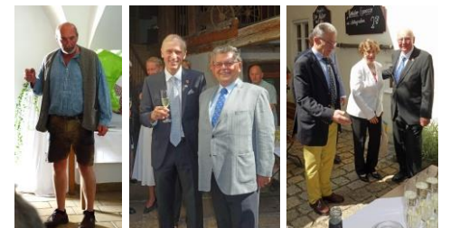
Impressionen der Governorübergabe