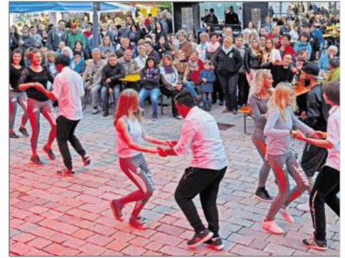
Ganz im Stil der amerikanischen Landbevölkerung tanzte das Paar (links) zur Musik der „Sunny Bottom Boys“. „The Spirit of Linedance Tirschenreuth“ (Mitte) zeigten ihr Können vor der Bühne. Der DS Dance Club aus Oberfranken verkörperte mit Hip-Hop und Dancehall das junge Amerika.