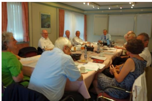
Sitzung am 20. Juli 2016 in Regensburg

Die Mitglieder jedes Distriktes wählen ihren Sprecher, ihre Sprecherin. Diese(r) leitet die Sitzung, die in seinem Distrikt stattfindet. Der Ausschuss tagt zweimal jährlich reihum wechselnd in den drei bayerischen Distrikten.