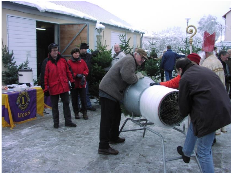
Zum 25. Mal führten die Lions vom Club Amberg-Sulzbach ihre Verkaufsaktion für garantiert frischgeschlagene Christbäume durch. Die Nachfrage war zuletzt so groß wie noch nie.