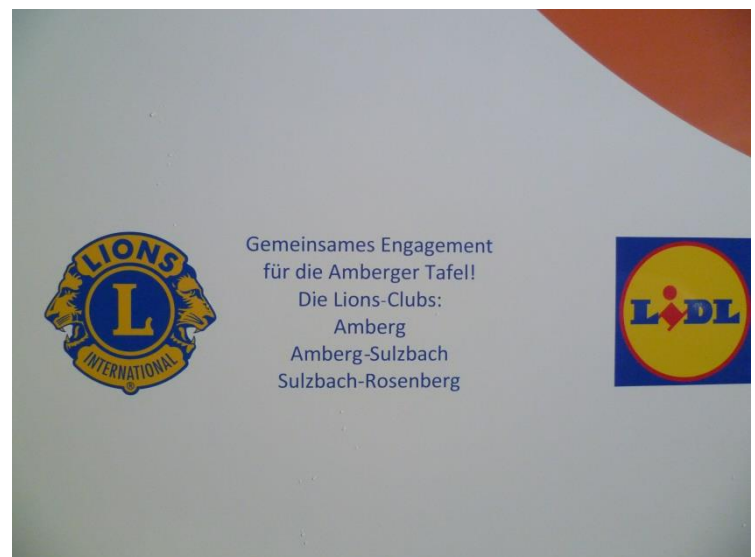
Das Lions-Logo weist die Clubs Amberg, Amberg-Sulzbach und Sulzbach-Rosenberg als Gönner der Amberger Tafel aus.