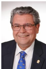
GOVERNOR 2018/2019 WOLFGANG DEBLER