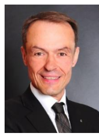
GOVERNOR 2019/2020 HÜESYIN ÇAKIR