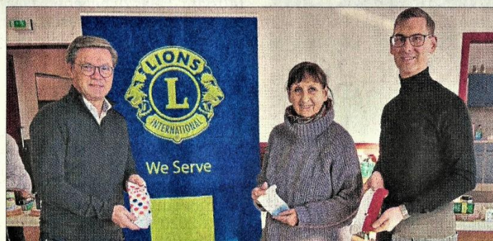
Der Lions-Club erhielt eine Sachspende.