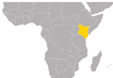
Zielort unseres WaSH-Projekts 2022/2023 ist Kenia im Osten des afrikanischen Kontinents