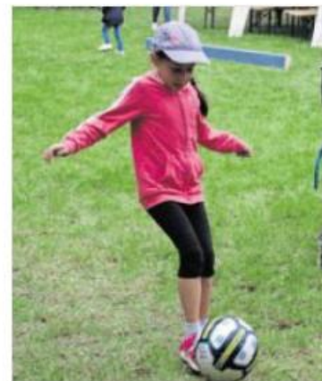
Immer wieder beliebt, das Schießen auf eine Torwand.

Werfen von Dart-Pfeilen, nächste Station ist das Treffen des Basketballkorbes. Weitere Stationen: Büchsenwerfen, Torwandschießen und Gleichgewicht auf einem Schwebebalken testen. Alle Teilnehmer erhalten eine Plakette als Erinnerung zum Mitnehmen. Für die Jüngsten gibt es Luftballons. Natürlich gibt es auch etwas zu Essen und Trinken, so sind eine Bratwurstsemmel, Pommes, Eis und Limo für Kinder kostenlos. Erwachsene und Eltern bezahlen jeweils 2 Euro. Die Veranstalter bitten die Eltern um Verständnis, dass kein Alkohol verkauft oder mitgebracht werden darf, handelt es sich doch um ein Kinderfest.