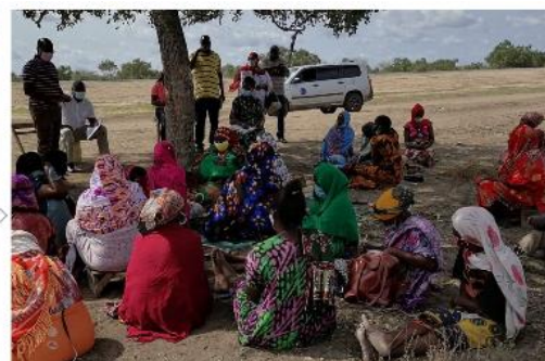
Besprechungen werden im Schatten der Bäume abgehalten | HFH