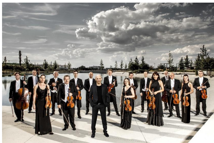
Beim Auftritt des Georgischen Kammerorchesters in Landshut stehen neben Stücken von Tschaiowsky und Mozart auch mitreißende georgische Melodien und Rhythmen auf dem Programm.

Die Tickets kosten 40 Euro pro Person. Die Einnahmen gehen an das Lions-Hilfswerk, das soziale Hilfsprojekte, kulturelle Initiativen sowie Bildungs- und Umweltaktionen in der Region Landshut unterstützt.