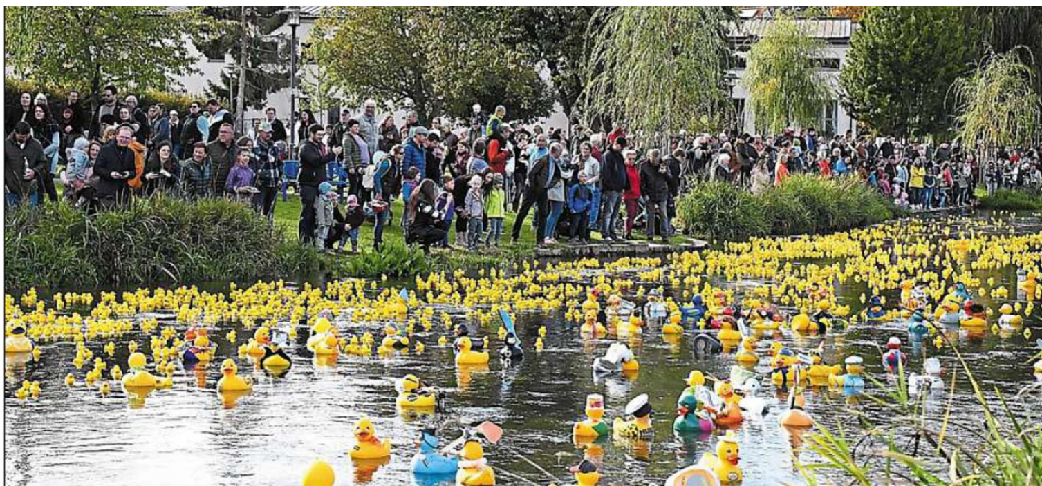
Einmal im Jahr herrscht auf der Beilngrieser Sulz großer Trubel – immer dann, wenn der Lions Club im Oktober sein Entenrennen veranstaltet.