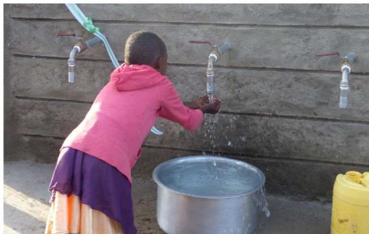
Sauberes Wasser soll bald an neuen Wasserausgabestellen verfügbar sein. | HfH