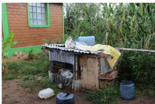
Substandard-Infrastruktur ist eine wichtige Herausforderung für Familien | HFH