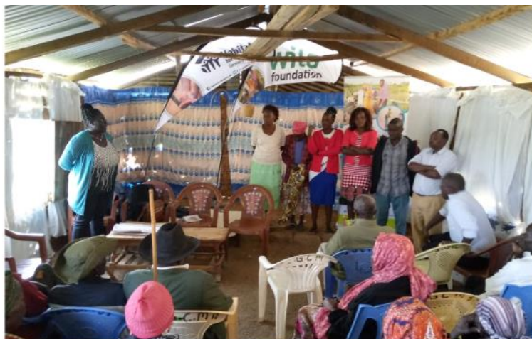
Wasser-Komitees werden im nachhaltigen Wassermanagement geschult und geben ihr Wissen weiter