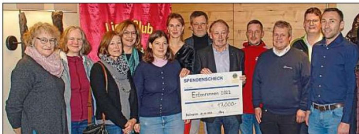
Der Lions Club hat Spenden in Höhe von insgesamt 17 000 Euro überreicht.

Dank der breiten Unterstützung durch die Beilngrieser Bevölkerung und Geschäftswelt war das 14. Beilngrieser Lions-Entenrennen beim Zwiebelmarkt im Oktober wieder ein voller Erfolg gewesen. Rund 3850 kleine gelbe Rennenten sowie 100 Sponsorenten konnten verkauft werden. In der vergangenen Clubsitzung des LC Beilngries war es nun so weit: Das Hilfswerk übergab Spenden von jeweils 3000 Euro an die Nachbarschaftshilfen (NH) von Beilngries, Berching und Riedenburg sowie an die Beilngrieser Tafel. Darüber hinaus erhielten drei Sportvereine und die Wasserwacht, die sich alle auch beim Verkauf der Rennlizenzen aktiv eingebracht hatten, für ihre Jugendarbeit einen Anteil aus dem Erlös des Entenrennens. Auf die Wasserwacht