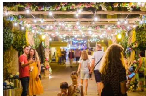
Touren & Freizeit