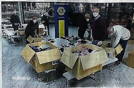
Das Umsortieren der Socken geschah in Teamarbeit in den Ausstellungsräumen des ehemaligen Autohauses Gröninger.

HEMAU. 5000 Paar Socken der Firma Falke wurden dem Lions Club Oberpfälzer Jura zur Weitergabe an karitative Organisationen gegen Sachspendquittung überlassen und von der Spedition Kiessling kostenfrei nach Hemaü geliefert. In den Ausstellungsräumen des ehemaligen Autohauses Gröninger hat ein Sockenzahl- und Sortiertrupp des Lions Clubs Oberpfälzer Jura die in Kartons angelieferten Kinder-, Damen- und Herrensocken gezählt, sortiert und in kleinere Gebinde umgeschichtet, um sie an soziale Einrichtungen übergeben zu können. Im Zuge der überörtlichen Zusammenarbeit hat der Oberpfälzer Jura einen Teil der Spende auch an Clubs in Straubing, Weiden und Marktredwitz abgegeben, heißt es in einer Mitteilung des Lions Clubs.