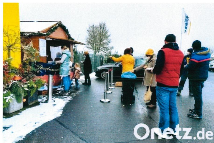
Bereits am frühen Morgen standen etliche Landkreisbürger am Stand des Lions-Clubs, um sich Lose zu kaufen. Die Aktion, die eigentlich am Kunsthandwerklichen Weihnachtsmarkt hätte stattfinden sollen, kam bestens bei den Bürgern an.