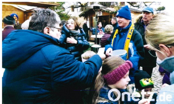
Wie jedes Jahr hatte der Lions-Club Tirschenreuth auch im Advent 2019 beim Kunsthandwerklichen Weihnachtsmarkt seinen Losstand aufgestellt. Damals durfte noch Trubel sein. Nun haben sich die Lions wegen Corona eine Alternative überlegt.

Der Losstand des Lions-Clubs am Kunsthandwerklichen Weihnachtsmarkt in Tirschenreuth ist eigentlich immer ein Anziehungspunkt. Nach der Absage des Markts müssen die Bürger aber auf die Lose und die Gewinne nicht verzichten.