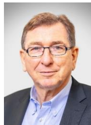
GOVERNOR 2025/2026 WOLFGANG HÖFLICH